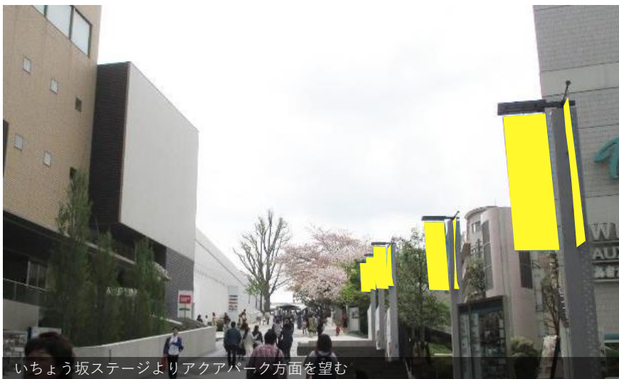
いちょう坂ステージよりアクアパーク方面を望む

いちょう坂を行き交う人々に対して、33枚のバナーフラッグで効果的にPR可能。スピーカーを利用することもできます。