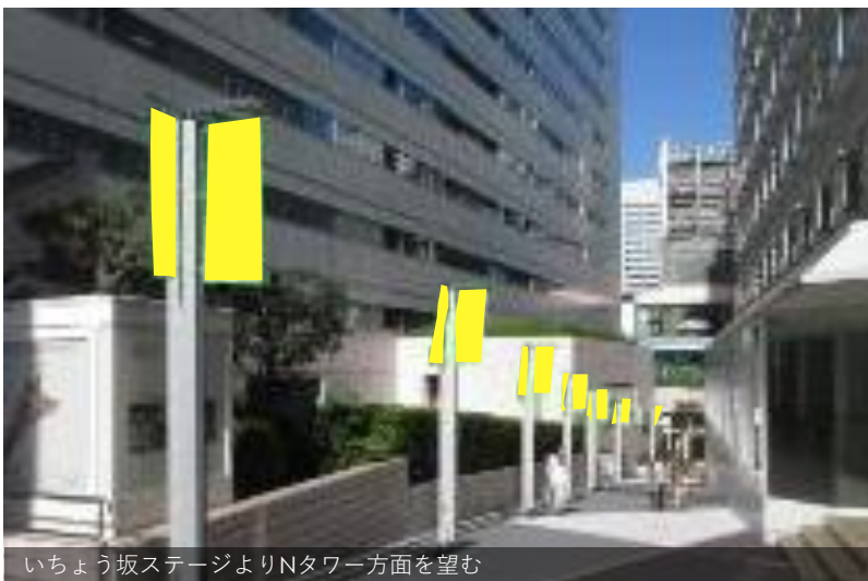
いちょう坂ステージよりNタワー方面を望む